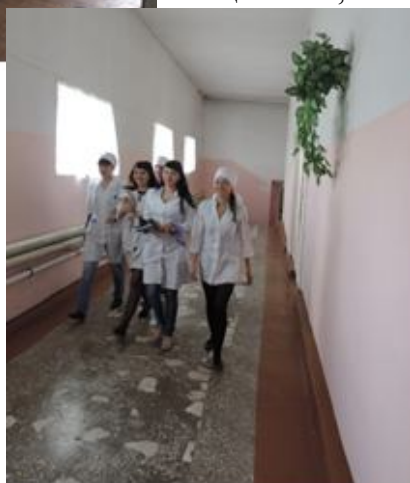
Теплый переход из общежития в учебный корпус

Возглавляет Студенческий совет общежития. Проживающие в общежития вместе с решить любые выслушать студентов. Студенты установленный