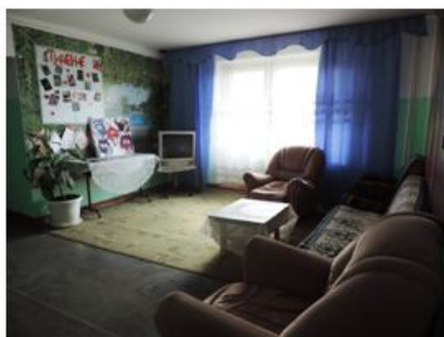
В холлах общежития

благоприятные условия проживания: удобные кухни с электрическими плитами, 2 умывальные комнаты, 2 туалета на каждом этаже. В общежитии имеется прачечная, оборудованная 4 стиральными машинами-автомат, а также местами для ручной стирки. Имеется сушильная комната, гладильная.